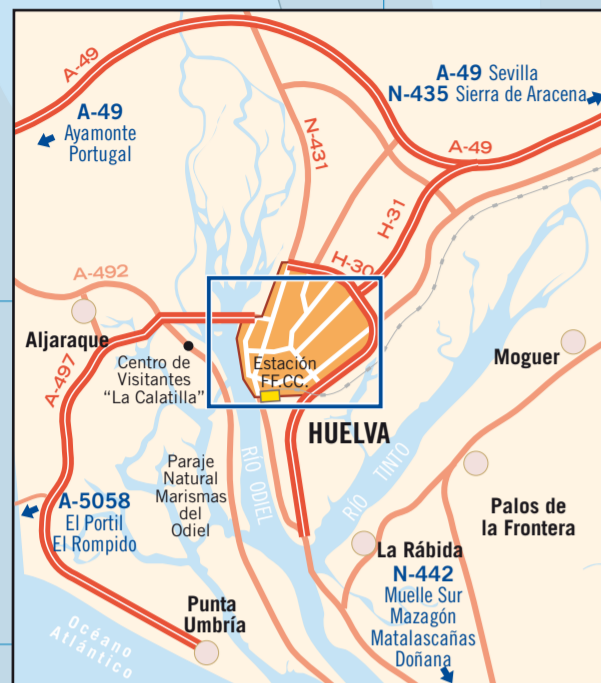
ACCESOS A HUELVA