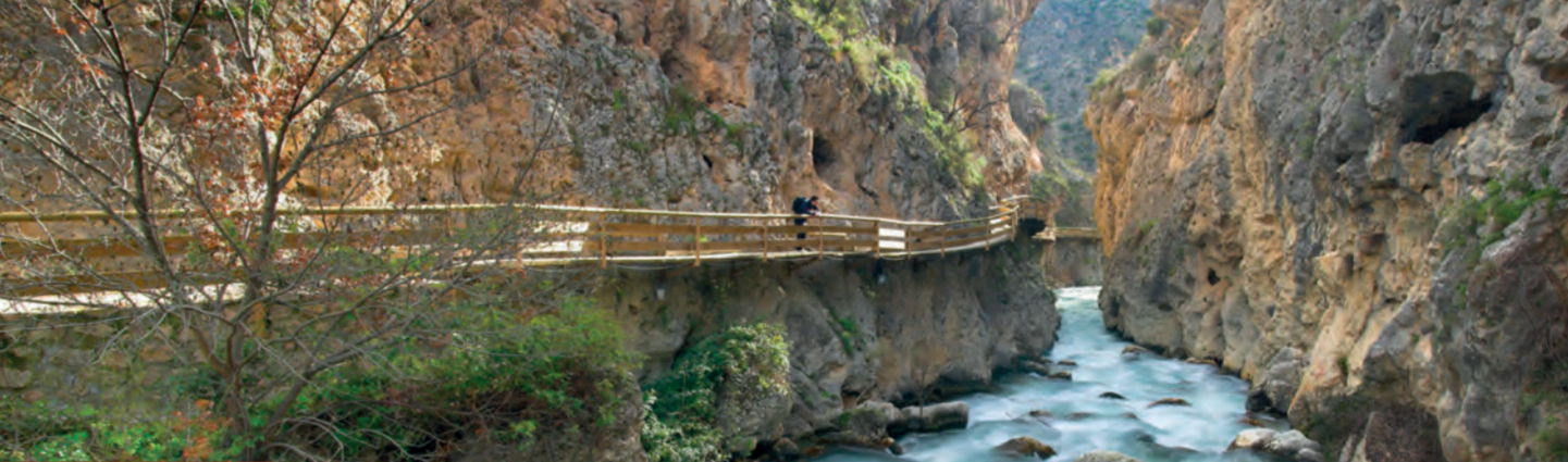
Brücke über den Fluss Castriil

In der Provinz von Jaén erstrahlt der Naturpark Sierra de Cazorla, Segura y Las Villas in einem ganz eigenen Licht. Er eignet sich ideal zur Beobachtung der Fauna, Wander-, Mountainbike- und Geländewagenausflüge, Ausritte und zum Wassersport im Stausee La Bolera .