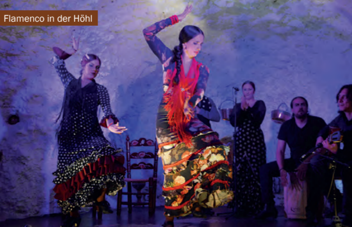
Flamenco in der Höhle

Am Barranco de los Negros der Provinzhauptstadt Granada befindet sich das Museum Cuevas del Sacromonte mit Inhalten zu Ethnologie und Umwelt sowie umfangreicher Information zur Höhlennutzung und der Geschichte des Flamenco.