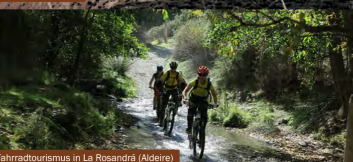
Fahrradtourismus in La Rosandrá (Aldeire)