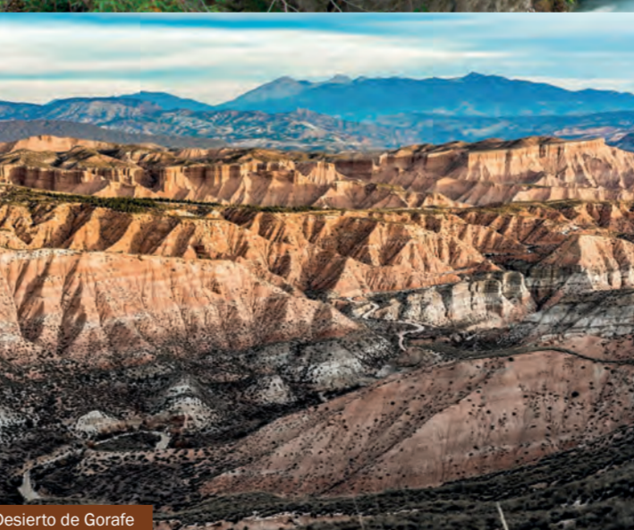
Desierto de Gorafe