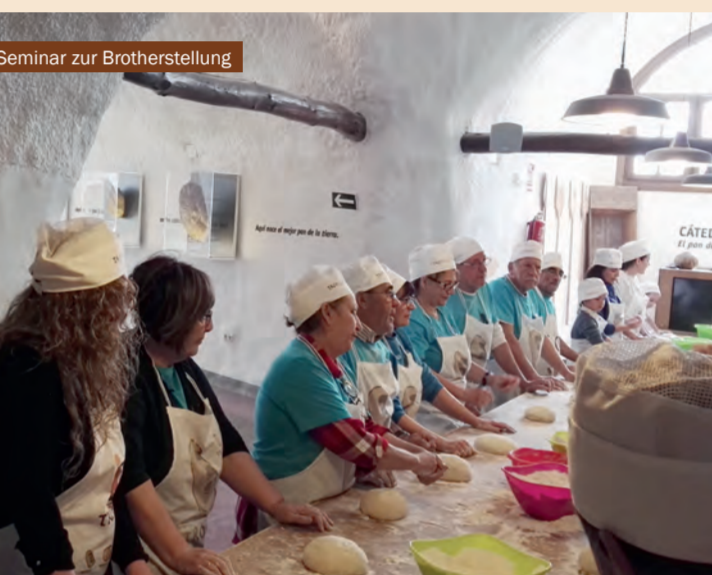
Seminar zur Brotherstellung

Die Besitzer der Höhlenwohnungen legen immer mehr wert darauf, ihre Gäste Umwelterziehung zugute kommen zu lassen und ihnen beispielsweise die Möglichkeit zu geben, in ihren Restaurant Produkte der Umgebung zu verzehren. Im Territorio Cueva ermöglicht der kulturelle Mehrzweckraum Trópolis den Besuchern die Herstellung des örtlichen Brots, des Weins, des Käses und des Kunsthandwerks zu erlernen und anzuwenden, und die Produkte mit nach Hause zu nehmen.